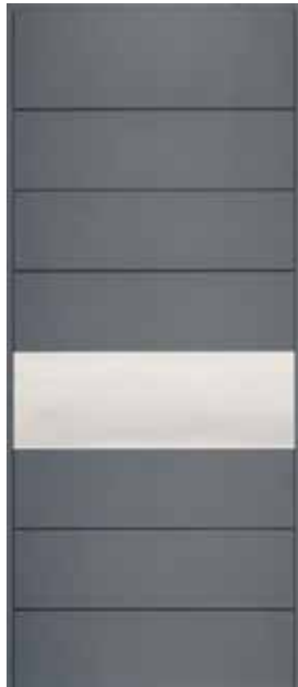
≡ COVER MMI01