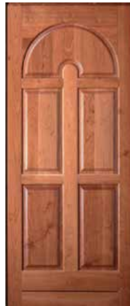
≡ COVER P354