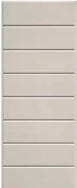
≡ COVER PR621