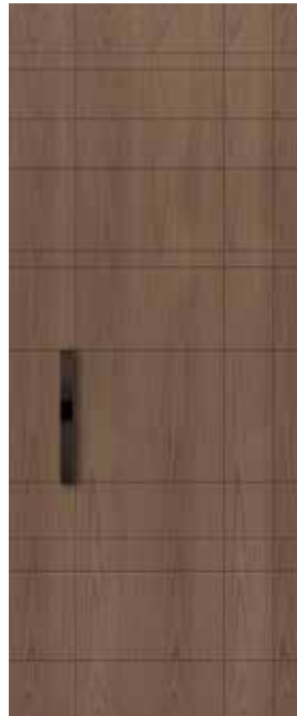
COVER SCM03/P (M03/P)