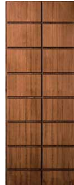
≡ COVER P805