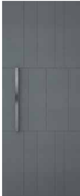
COVER SCM01/P (M01/P)