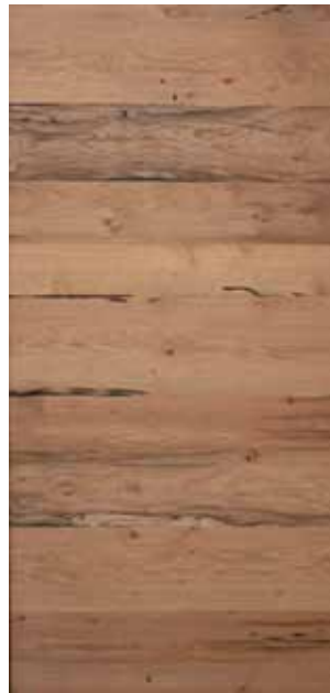
≡ COVER BRICCOLE