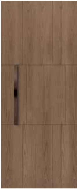
≡ COVER M01