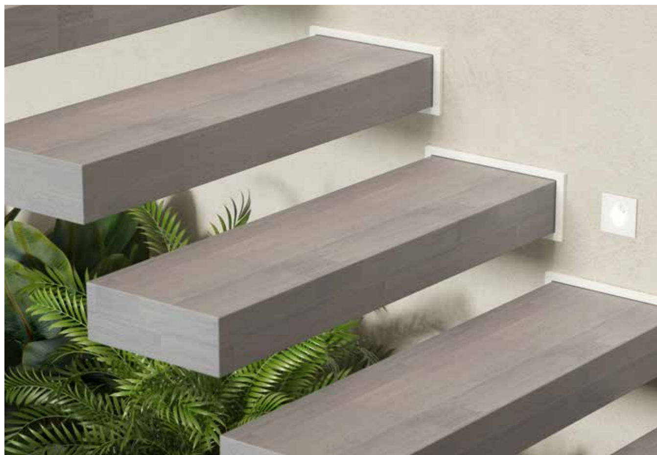
Dettaglio gradino e fissaggio a muro portante con struttura in acciaio verniciato Bianco 22. Detail of step and securing to load-bearing wall with White 22 painted steel structure.

12 floating steps, straight configuration. Wooden steps with Concrete 89 finish and White 22 structure.