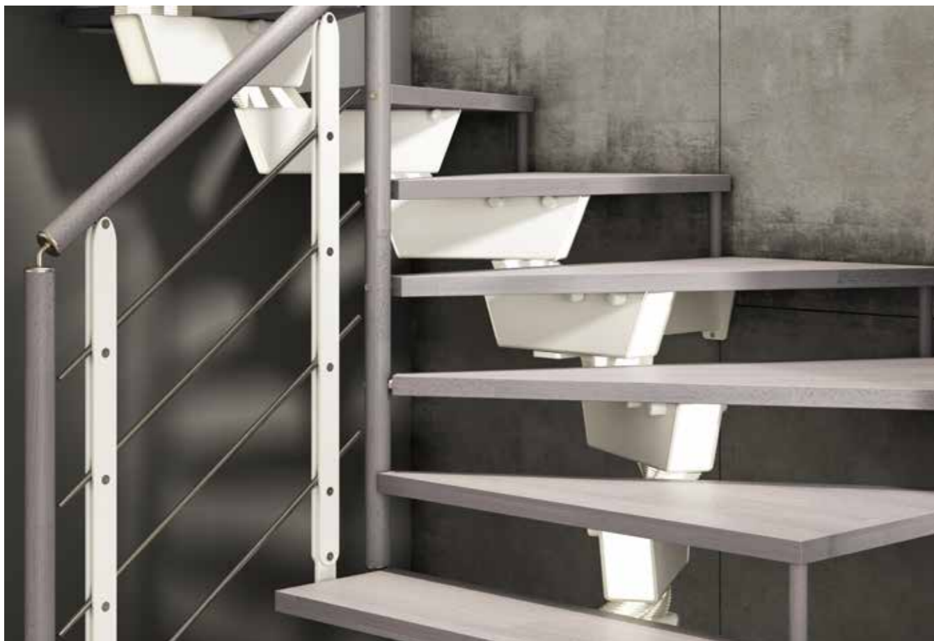
Dettaglio della sezione scala a due giri con 6 gradini sagomati. Gradini e corrimano Cemento 89, struttura e montanti in acciaio verniciato Bianco 22. Detail of a section of the staircase with 2 turns and 6 shaped steps. Steps and handrail in Concrete 89, structure and posts in White 22 painted steel.