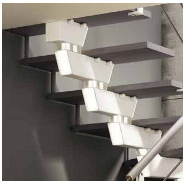
Dettaglio della struttura in acciaio verniciata Bianco 22 e dei distanziali per la regolazione dell'altezza. Illuminazione LED integrata.