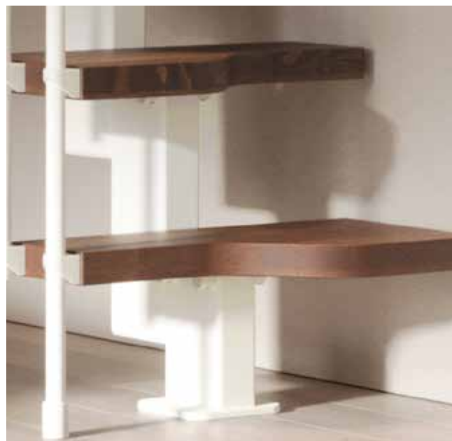
Dettaglio del gradino sagomato a pedata alternata. Gradini Noce 25 struttura e ringhiera Bianco 22.