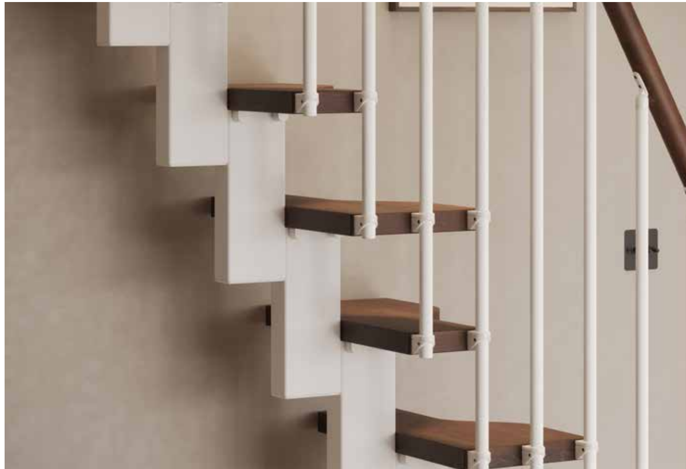
Dettaglio della struttura in acciaio verniciata Bianco 22. Ringhiera a colonnine verticali in acciaio verniciato Bianco 22. Detail of the White 22 painted steel structure. Banister with vertical spindles in White 22 painted steel.